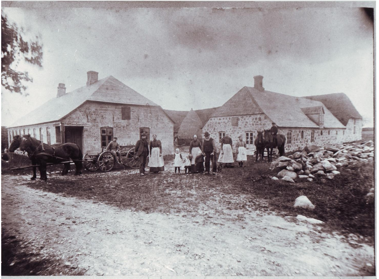
Gammelgaard. Billedet må være taget ca. 1896.