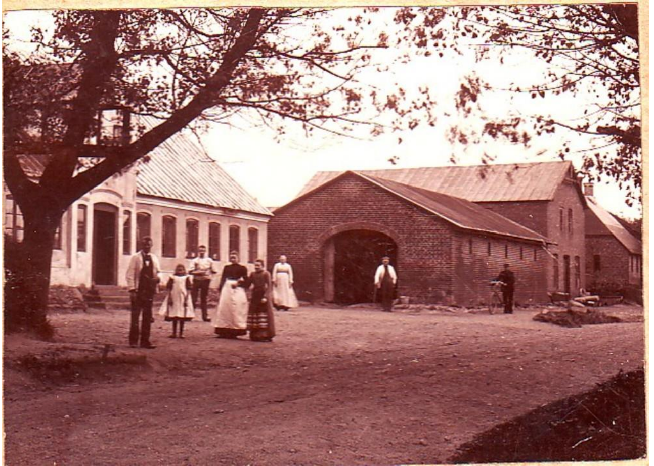
Den gamle kro i Ansager