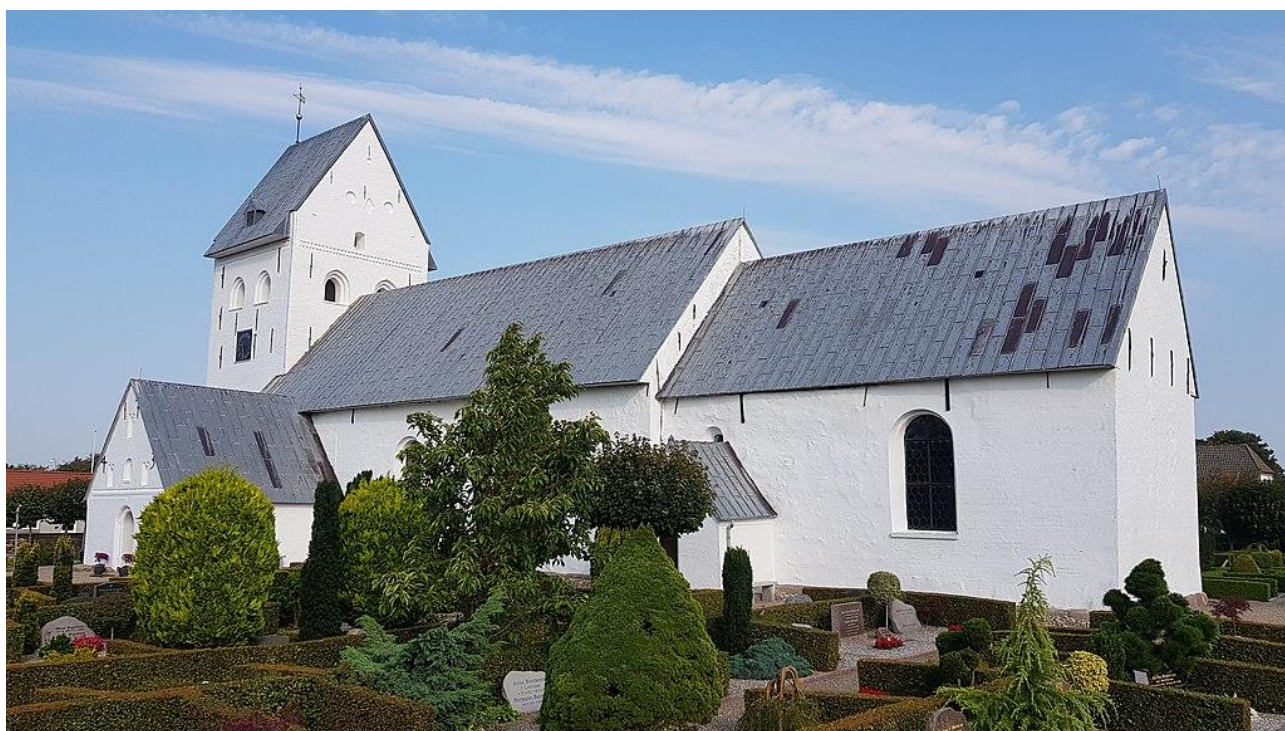
Ravsted kirke.